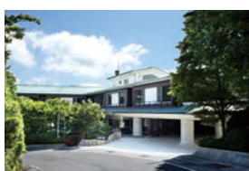
ラフォーレ倶楽部 箱根強羅 湯の棲 0460-86-1489