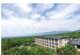
リゾートホテル ラフォーレ那須 0287-76-3489