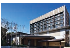
ラフォーレ倶楽部 伊東温泉 湯の庭 0557-32-5489